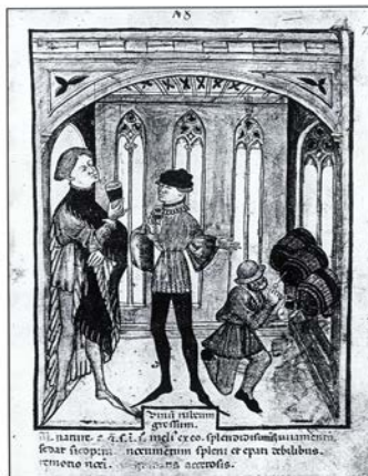
- Dégustation de vin en cave - Traduction latine (1 er moitié du XV e siècle) du Tecunum sanitatis , par Albucassis, médecin du XIII e siècle. Bibliothèque Nationale de France, Paris.

Cet outil rend possible plusieurs types de recherches complémentaires en matière d'histoire des sciences et techniques de la vigne et du vin. Les nombreux rapports, comptes rendus de recherches et extraits de congrès qui enrichissent la revue offrent un cadre inédit d'étude des réalités historiques et des évolutions des pratiques vitivinicoles sur le XX e siècle. Ils permettent d'appréhender la place des savoirs scientifiques dans la production des décisions internationales en matière de viticulture, de vinification et de droit. Le Bulletin de l'OIV se fait aussi l'écho des législations nationales ou des accords bilatéraux et multilatéraux internationaux. Ces données rendent possibles une histoire des normes juridiques, commerciales, techniques et sanitaires de la vigne et du vin au plan mondial et permettront l'étude des rapports de force autour des enjeux commerciaux de la vigne et du vin. L'existence de rubriques statistiques dans tous les bulletins offre par ailleurs un outil incomparable pour analyser en détail les marchés, les évolutions de consommation, ou les territoires du vin au sens large. Il s'agit également de procéder à une étude des normes internationales communes d'analyse des vins et de classification des produits, de questionner les approches sanitaires et environnementales mondiales.